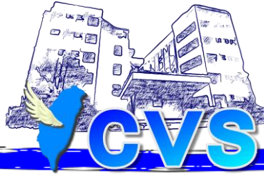
業務報告 1-實習主任