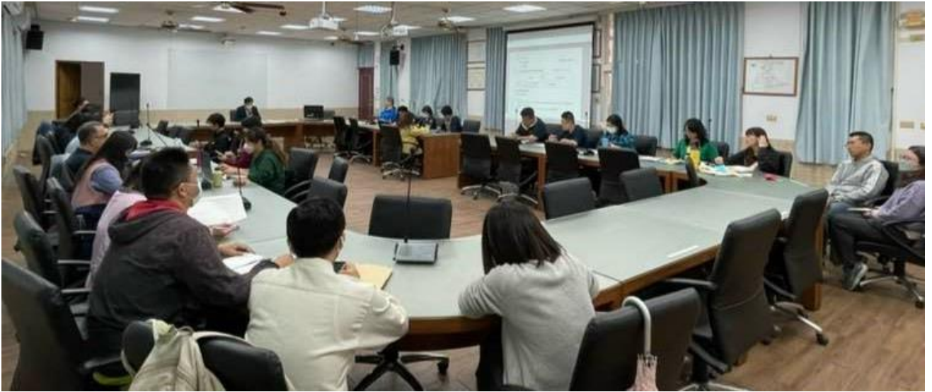
國立玉井高級工商職業學校 112 學年度第 10 行政(擴大)會議照片