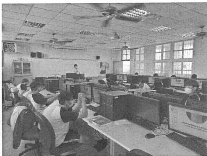
教學演示及公開觀課現場